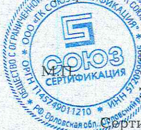
Схема сертификации: ГС